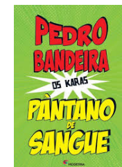
PÂNTANO DE SANGUE Pedro Bandeira (EDITORA MODERNA)