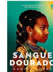
SANGUE DOURADO Namina Forna (EDITORA GALERA)