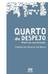
QUARTO DE DESPEJO Carolina Maria de Jesus (EDITORA ÁTICA)