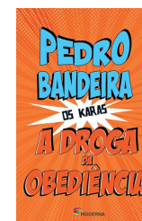
A DROGA DA OBEDIÊNCIA Pedro Bandeira (EDITORA MODERNA)