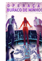
OPERAÇÃO BURACO DE MINHOCA Laura Bergallo (EDITORA DCL)