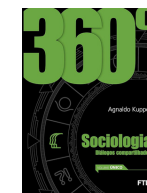
SOCIOLOGIA 360º SOCIOLOGIA DIÁLOGOS COMPARTILHADOS. VOL. ÚNICO. AGNALDO KUPPER. 1ª ED. FTD.