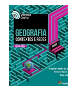
GEOGRAFIA VEREDA DIGITAL – GEOGRAFIA CONTEXTO E REDES VOLUME ÚNICO. ÂNGELA CORRÊA DA SILVA / NELSON BACIC OLIC / RUY LOZAN. 2ª ED. EDITORA