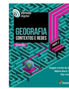
GEOGRAFIA VEREDA DIGITAL – GEOGRAFIA CONTEXTOS E REDES VOLUME ÚNICO. ÂNGELA CORRÊA DA SILVA / NELSON BACIC OLIC / RUY LOZAN. 2ª ED. EDITORA