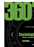
SOCIOLOGIA 360º SOCIOLOGIA DIÁLOGOS COMPARTILHADOS. VOL. ÚNICO. AGNALDO KUPPER. 1ª ED. FTD.